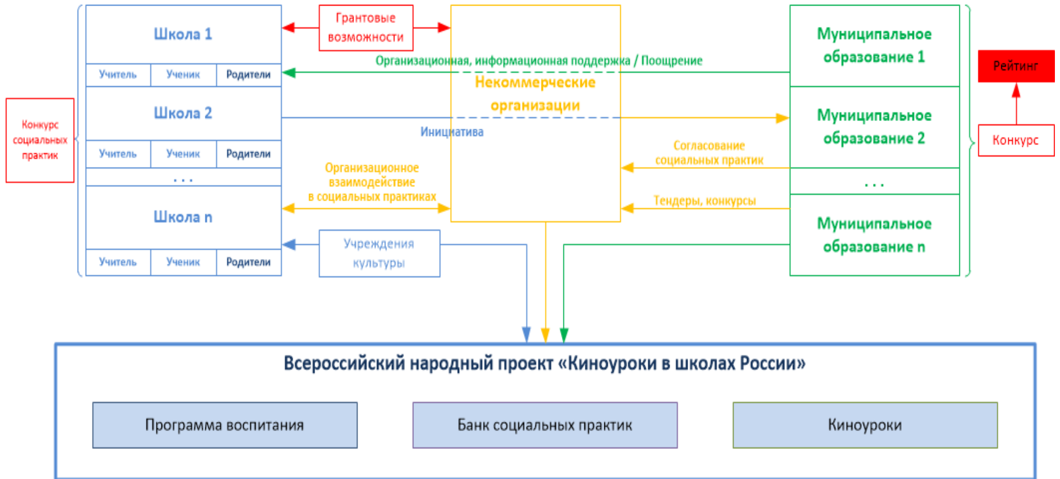
Модель организации социальных практик